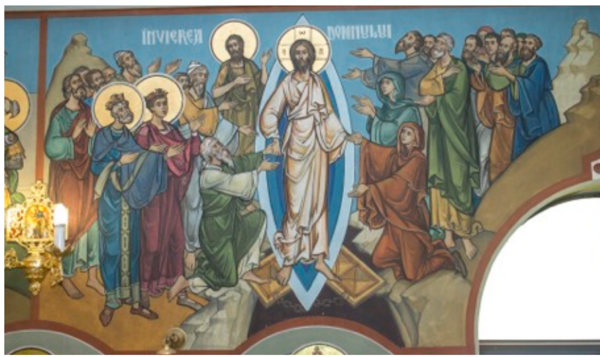
Icoana Invierii zugravita pe peretele din interiorul bisericii noastre

Al Episcopiei Ortodoxe Române a Australiei și Noii Zeelande